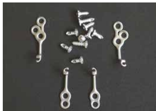
Fig. 1 Bone anchored Bollard miniplate with screws – one patient set